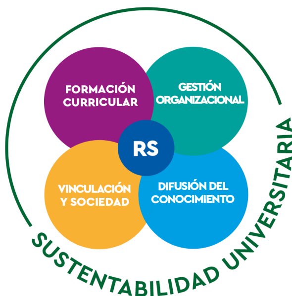
Gráfica 3: MODELO DE RESPONSABILIDAD SOCIAL Y SUSTENTABILIDAD UNIVERSITARIA

De manera gráfica, es que se propone un modelo de implementación en la Facultad de Economía y Negocios de la Universidad de Chile, que refleja y coincide con los principales objetivos a concretar dentro de la formación de los estudiantes de pregrado; un modelo que busca la inclusión y la interrelación en todas sus aristas, en donde confluyen todos los componentes de una comunidad universitaria- docencia, investigación extensión y gestión- los cuales se respetan, conviven y promueven para hacer educación de forma innovadora, integral y socialmente comprometida con su régimen interno, que además tiene como consecuencia directa el efecto positivo en el entorno.