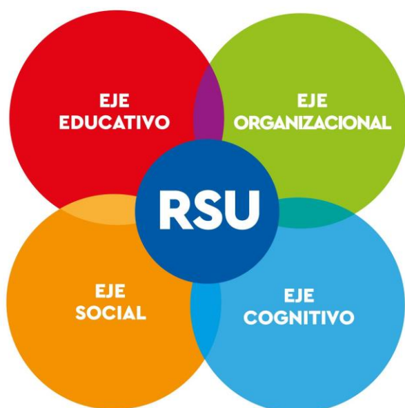
Gráfica 1: MODELO RSU FEN 2009-2017

En este proceso, se incorporan progresivamente, los cuatro ejes de acción que responden a los impactos que la facultad genera, principalmente en el pregrado. Como muestra la gráfica 1, desde el eje educativo, social, cognitivo y organizacional.